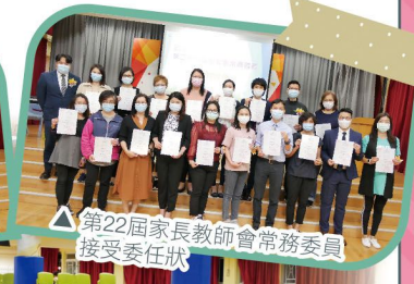
▲ 第22屆家長教師會常務委員接受委任狀