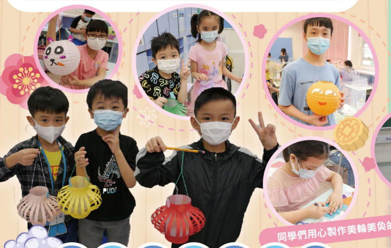
同學們用心製作美輪美奐的中秋花燈