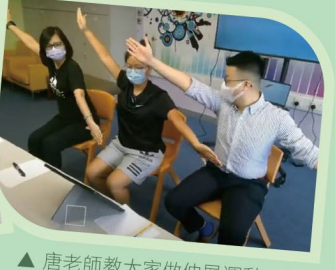
▲唐老師教大家做伸展運動，楊主任則教大家製作健康五色沙律。