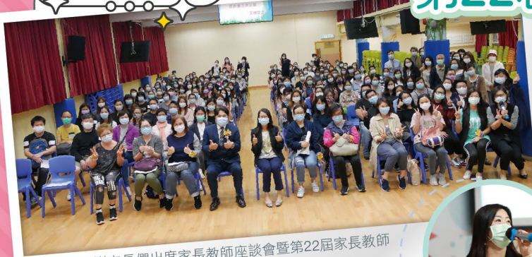
▲ 感謝家長們出席家長教師座談會暨第22屆家長教師會常務委員就職典禮