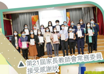
▲ 第21屆家長教師會常務委員接受感謝狀