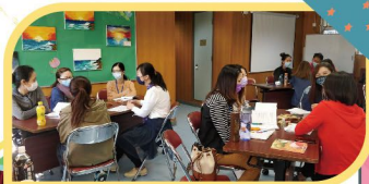
▲ 家長們在小組內互相分享，真的令大家獲益良多

(每月最後禮拜四上午10:00至12:00) 內容：電影分享、行山、手工DIY、護膚品DIY，歡迎所有家長參加