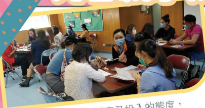
▲ 家長們努力、認真及投入的態度，真是小孩子學習的對象。