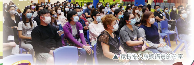
▲ 家長投入聆聽講員的分享