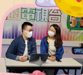
老師化身KOL為大家分享中秋節的由來