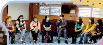
▲ 校長與家長一同分享代禱事項，讓家長也成為學校的同路人，以禱告關心學校的需要。