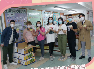
▲家教會成員向回校學生送上黃金梨