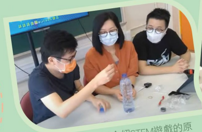
▲余老師介紹STEM遊戲的原理，林主任教授客家話。

今年九月舉辦了三場《亞小KOL》YouTube直播學習節目，老師透過直播與百多位同學進行即時互動，教授新奇有趣的知識，以及分享特別的技能，鼓勵學生在家也能自我增值，學習上至天文、下至地理、左至音樂、右至文學的知識！縱使我們隔着熒幕見面，同學們也十分投入，在直播中積極地參與討論，一同HAPPY LEARNING!