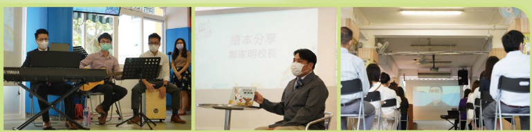
▲ 在這重要的日子，老師樂隊再次出場，為開學禮加添熱鬧的氣氛。