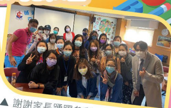
▲ 謝謝家長踴躍參與，期望大家一同好好學習，為孩子的未來努力！

「兒童親子教育課程」是一個專為10歲以下兒童之父母和照顧者而設的課程。全套課程共分為十個單元，以主題討論、小組分享等形式進行。透過不同的主題，與參與者一同探討如何處理日常親子之間的問題，幫助家長與孩子建立親密關係，並學會一套以「愛」為主的「教養之道」，藉以讓孩子有更全面的成長。