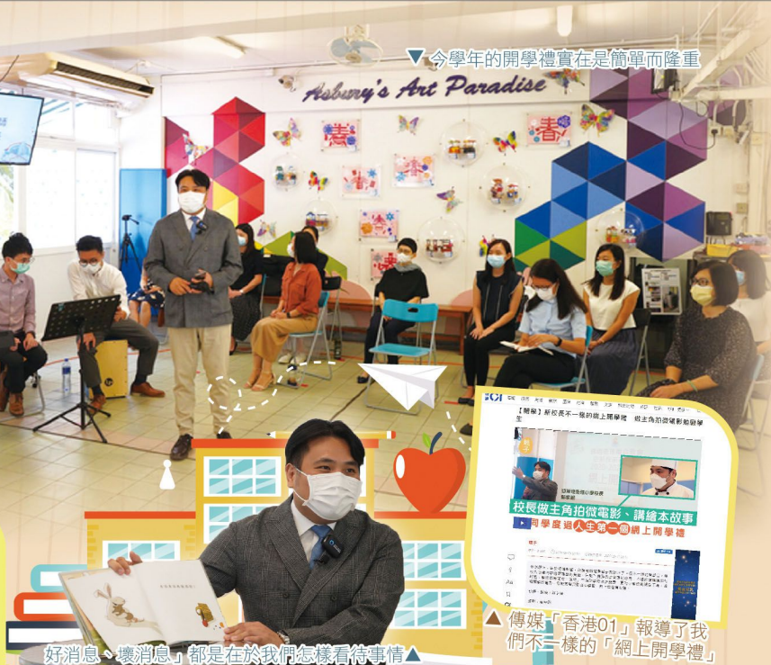
好消息、壞消息 都是在於我們怎樣看待事情

今年的9月1日，如常是亞小一年一度的開學禮。雖然沒有了同學們步進校園的腳步聲，卻換來網絡上「叮叮噹噹」的登入聲；雖然未能看清每一個同學們的笑容，不過同學們的歡笑聲仍是此起彼落。在開學禮中，師表們為大家預備抗疫微電影首播鄭校長為我們分享繪本故事，亦為大家逐一介紹了本學年的新老師，更加入了新的環節——「全體老師獻唱詩歌」，令整個校園、以及網絡上也充滿了大家感謝讚美上帝的歌聲……這一個不一樣的網上開學禮，真的叫人沒齒難忘喔！