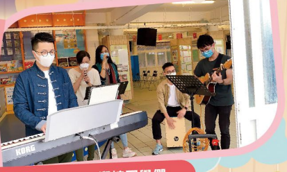
踏進校園，就有校長和老師們來以Busking迎接同學們