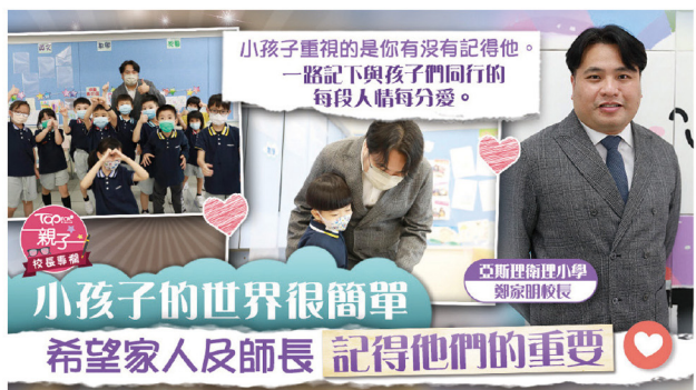
▲ 小孩子的世界很簡單，希望家人及師長記得他們的重要。

想到子女的事情，家長們最要記得的是哪一樣？幼稚園的爸媽當然在掛心為孩子們找到理想的小學。小學和中學的家長也在為孩子作最好準備，深願他們入讀心儀的學府。疫情下學習不斷變化，網上網下忙個不停，孩子在家中的時間多了，家長更看到子女的學習「真相」，換來的或是更多的「勞氣時間」，整天也在提醒孩子要記得這樣那樣。