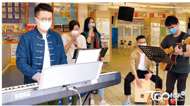
▲ 多位老師現場開 SHOW，唱出改編歌《等你上課》歡迎學生。(受訪者提供)