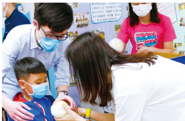
▲ 在放學時，更送家長一人一個梨子，表達關心。

他謂自己喜歡用故事跟家長打開話題，過往他的工作亦是涉及家長教育以及繪本生命教育。向學生講故事，一直是他的熱愛，校長指出，希望上任後能舉辦「家長閱讀會」，在「家長閱讀會」上，鼓勵家長在家中也多跟子女講故事。